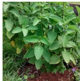
Figura 2 – Boldo-baiano