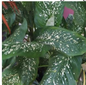
Figura 9 – Comigo-ninguém-pode