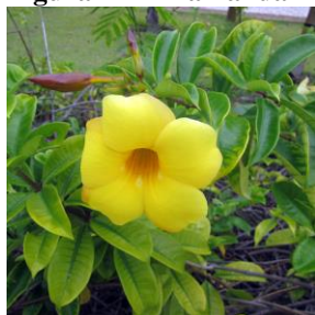
Figura 11 – Alamanda