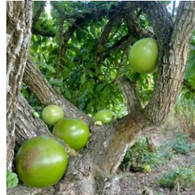
Figura 4 – Coité