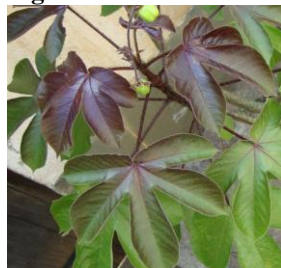
Figura 5 – Piãoxo