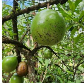
Figura 3 – Coité