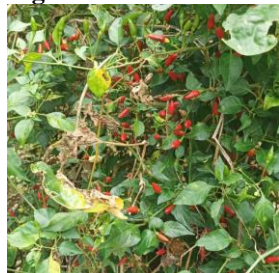
Figura 7 – Pimenta-malagueta