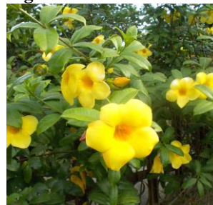
Figura 12 – Alamanda