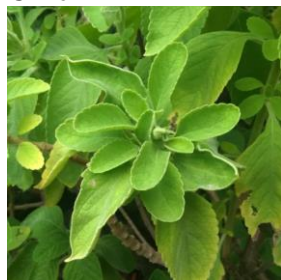
Figura 1 – Boldo-do-Chile