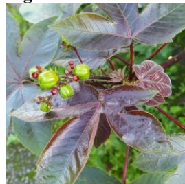
Figura 6 – Piãoxo