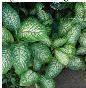
Figura 10 – Comigo-ninguém-pode