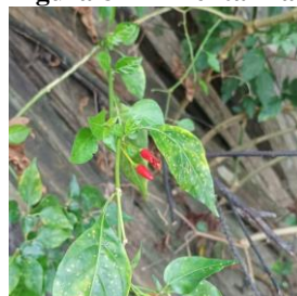
Figura 8 – Pimenta-malagueta