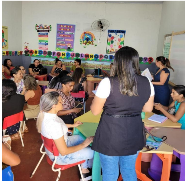
Figura 4 - Formação inclusiva no turno vespertino.