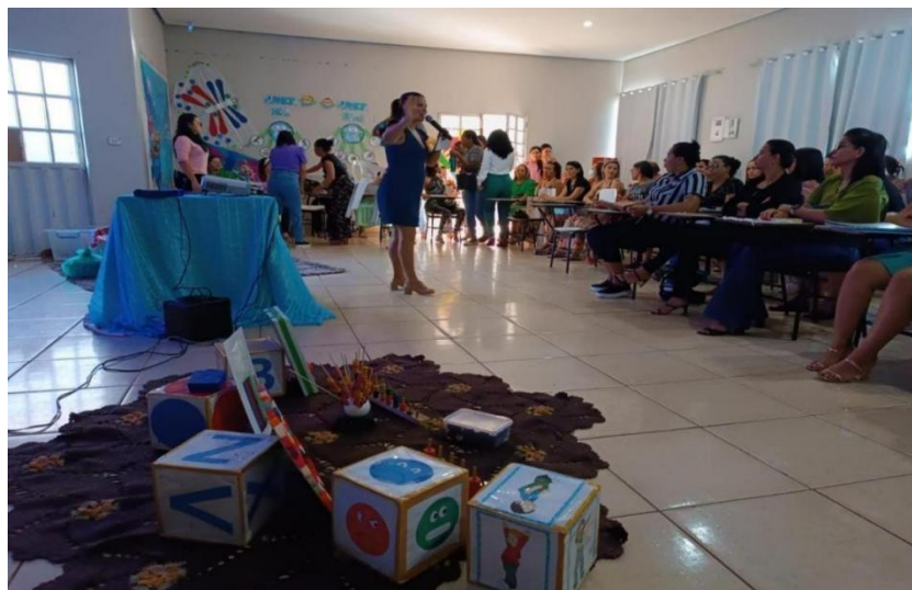
Figura 3 - Formação pela manhã.

Registro fotográfico de todas as participantes da formação continuada para professoras e professores do município de Açailândia - MA. A quantidade considerável de docentes presentes chegou a 85 e foram quase toda de mulheres, havia apenas um homem. Pessoas que alcançaram respostas de dúvidas e participaram de discussões significativas para a sua atuação profissional.