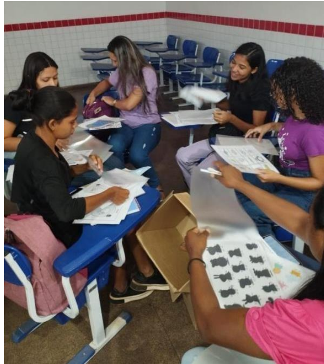
Figura 6 - confecção dos materiais inclusivos.