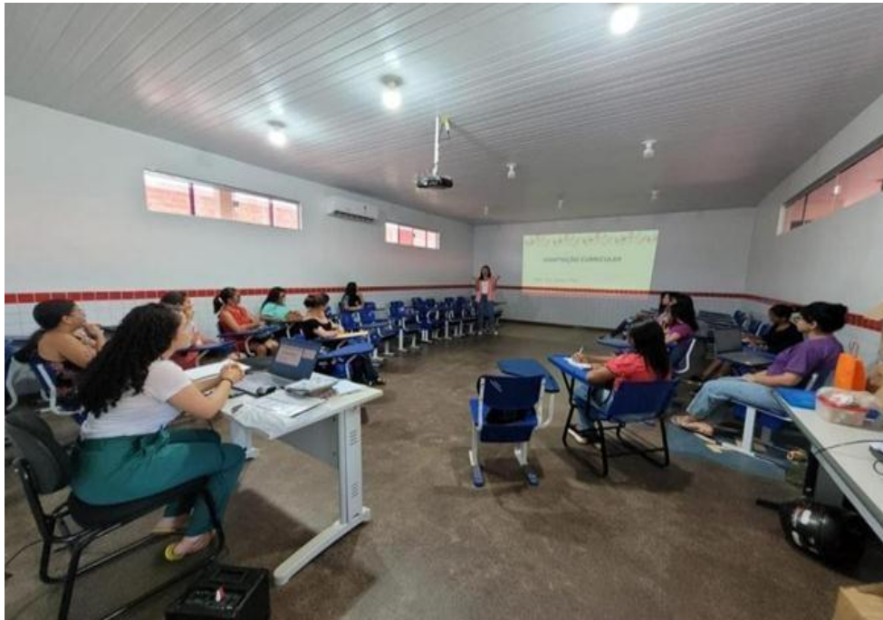
Figura 5 - Discussão acerca dos usos dos materiais pedagógicos.