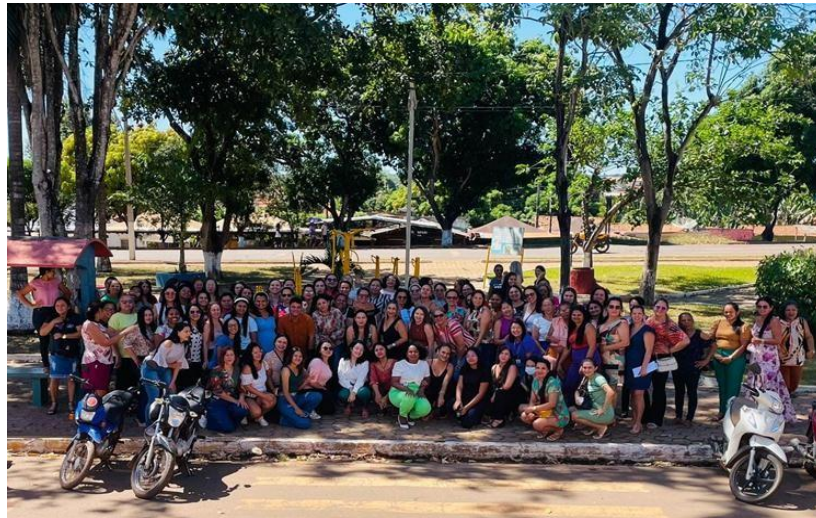
Figura 2 – Formação inclusiva na educação infantil em Açailândia.