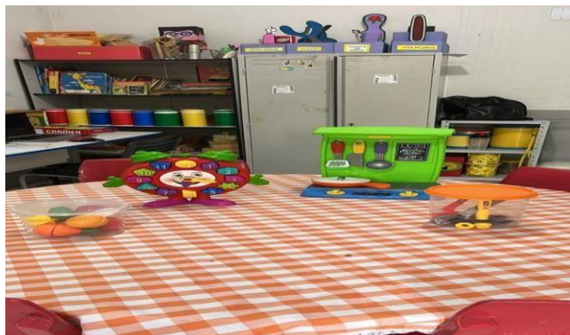
Figura 1 - Espaço arquitetônico do AEE no polo visitado.

Contudo, a análise dessa visita e dessas interações ou a falta delas proporcionam um melhor entendimento do que é vivido na realidade da cidade de Açailândia – MA. E por meio deste, foi possível vislumbrar ações que auxiliaram nesse aspecto de forma considerável para as professoras e professores do município que apresentam uma ausência de preparação e troca de conhecimentos de diversas áreas da vida do aluno com autismo.