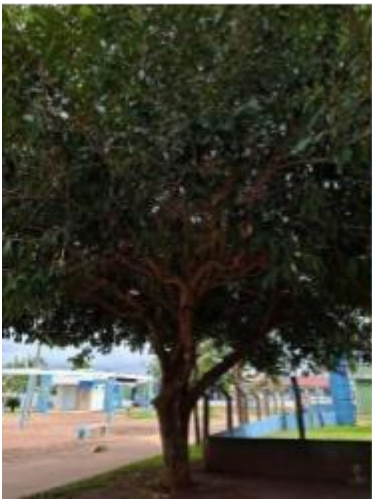
Figura 16. Autor. 2025