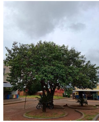
Figura 6. Autor. 2025