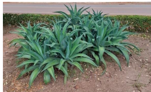
Figura 30. Autor. 2025