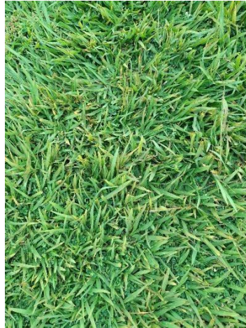
Figura 32. Autor. 2025