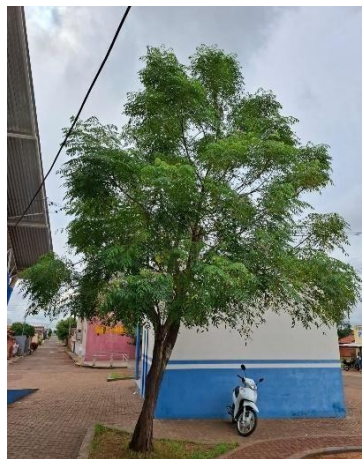
Figura 8. Autor. 2025