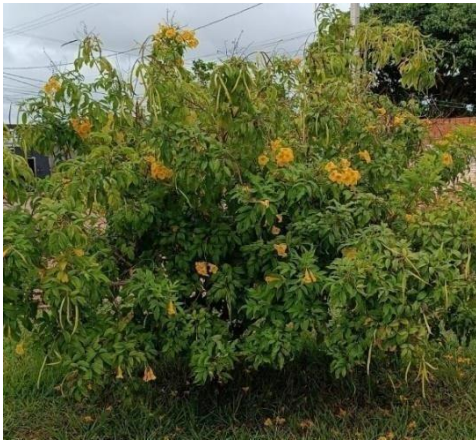
Figura 31. Autor. 2025