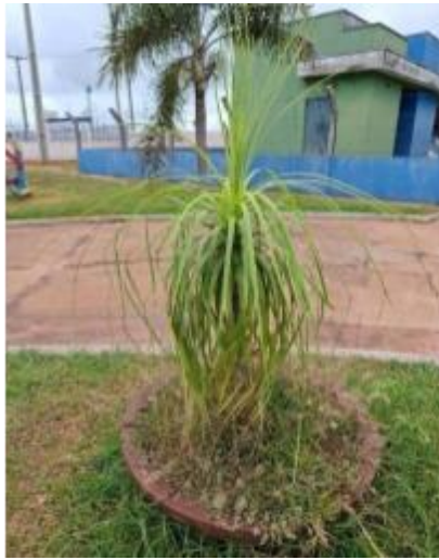
Figura 17. Autor. 2025