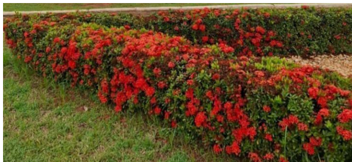
Figura 24. Autor. 2025