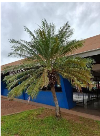
Figura 7. Autor. 2025