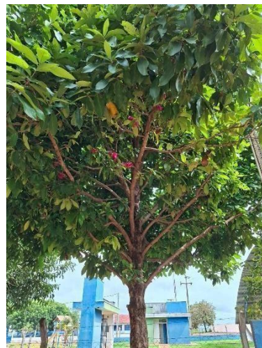
Figura 9. Autor. 2025