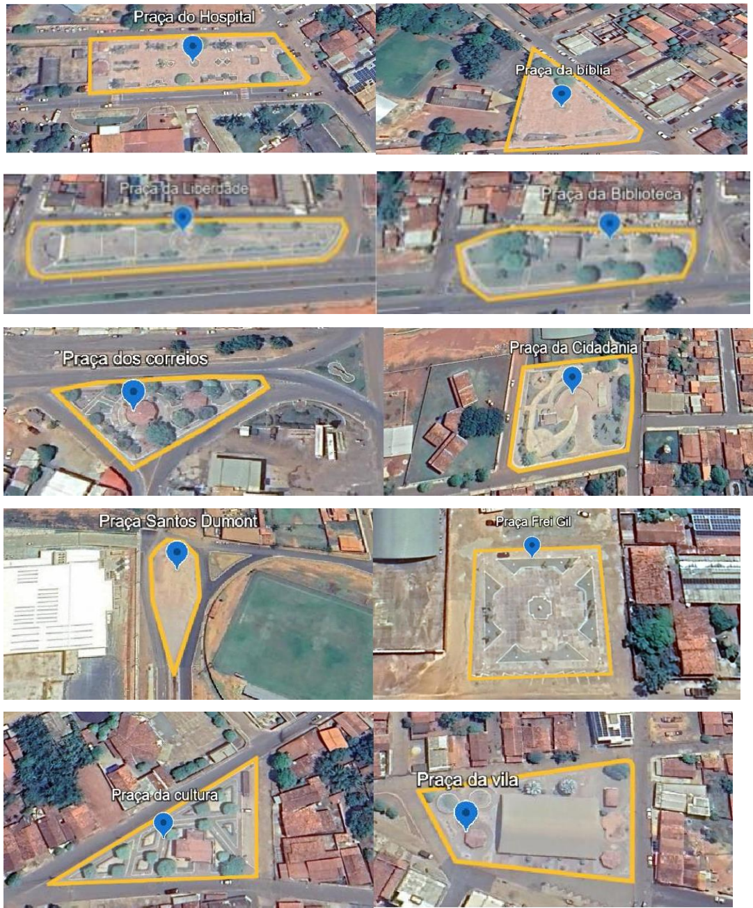
Figura 1: Vista aérea das localidades das praças em estudo.