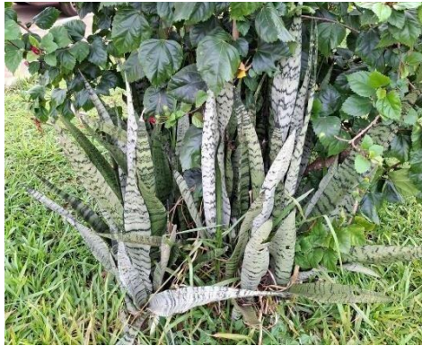
Figura 22. Autor. 2025