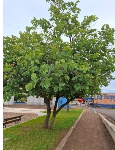
Figura 15. Autor. 2025