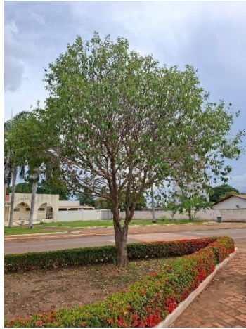
Figura 11. Autor. 2025