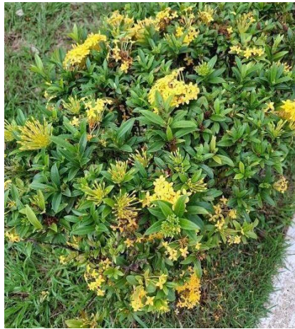
Figura 25. Autor. 2025