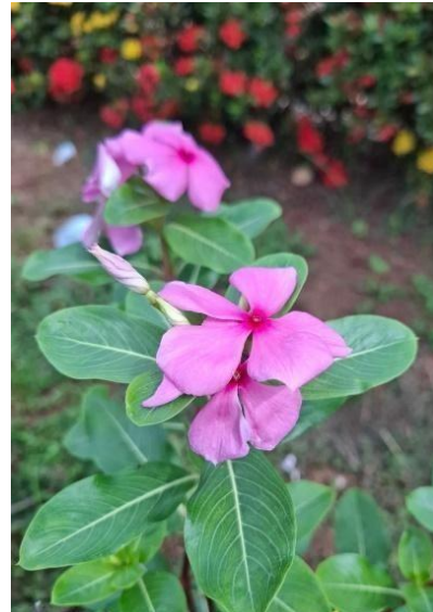
Figura 28. Autor. 2025