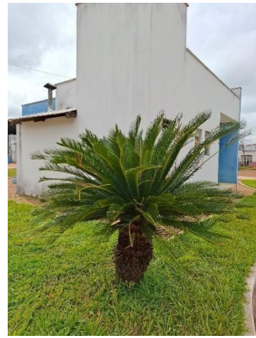
Figura 3. Autor. 2025