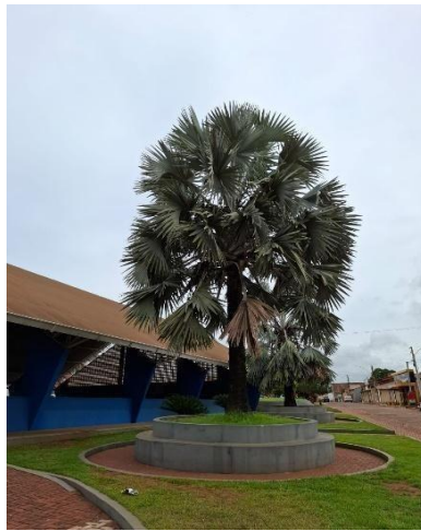
Figura 5. Autor. 2025