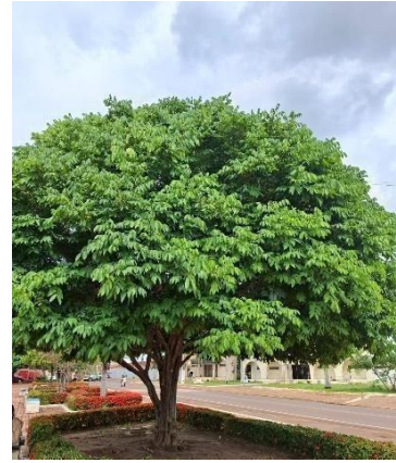
Figura 12. Autor. 2025