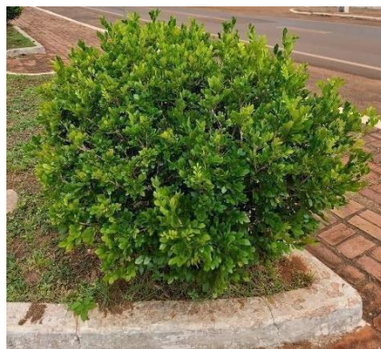
Figura 29. Autor. 2025