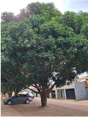
Figura 10. Autor. 2025