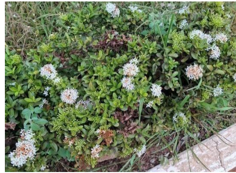
Figura 23. Autor. 2025