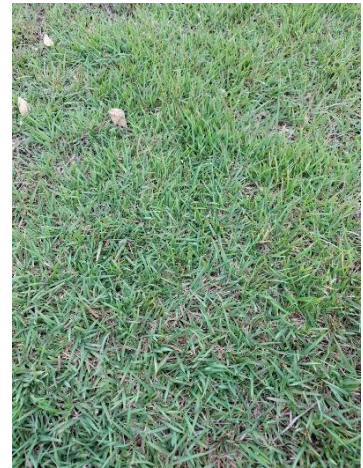
Figura 33. Autor. 2025

No levantamento realizado nas dez praças públicas de Estreito-MA, foram mensurados e identificados 163 indivíduos, sendo 86 palmeiras e 77 árvores. Também se constatou a presença de 12 indivíduos herbáceos, 13 arbustivos (ixora contendo três espécies diferentes) e duas espécies de forração, distribuídos em 28 espécies e 12 famílias botânicas (Tabela 2). As famílias que apresentaram maior riqueza de espécies foram Arecaceae (4), Fabaceae (4) e Myrtaceae (4), que juntas representam 60% do número total registrado. As demais famílias contribuíram para a composição da diversidade florística das praças com no máximo duas espécies de cada.