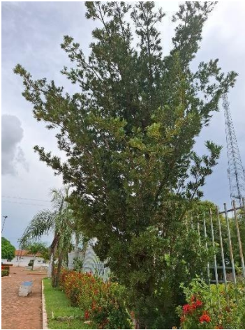
Figura 13. Autor. 2025