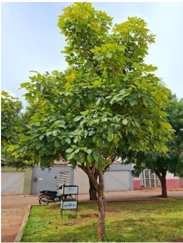
Figura 4. Autor. 2025