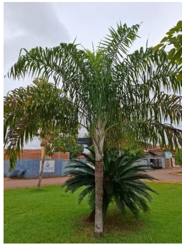
Figura 2. Autor. 2025