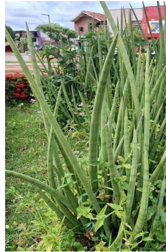
Figura 26. Autor. 2025