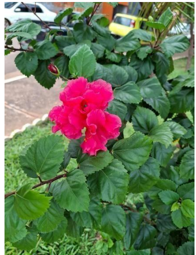
Figura 18. Autor. 2025