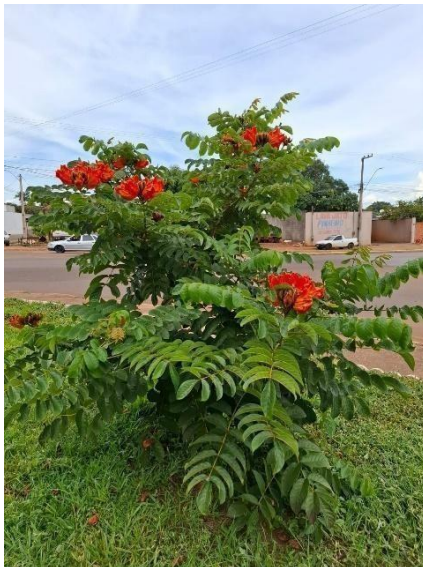
Figura 27. Autor. 2025