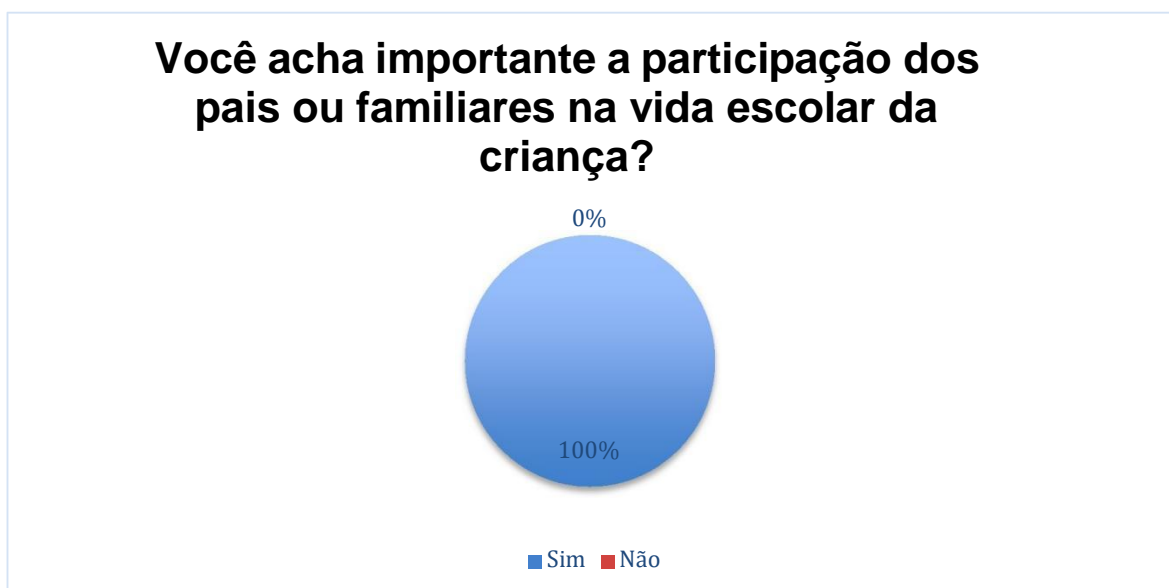
Gráfico 2- A Importância da participação dos pais ou responsáveis na vida escolar da criança

No gráfico a seguir mostramos o resultado das respostas dos pais ou responsáveis participantes da pesquisa: