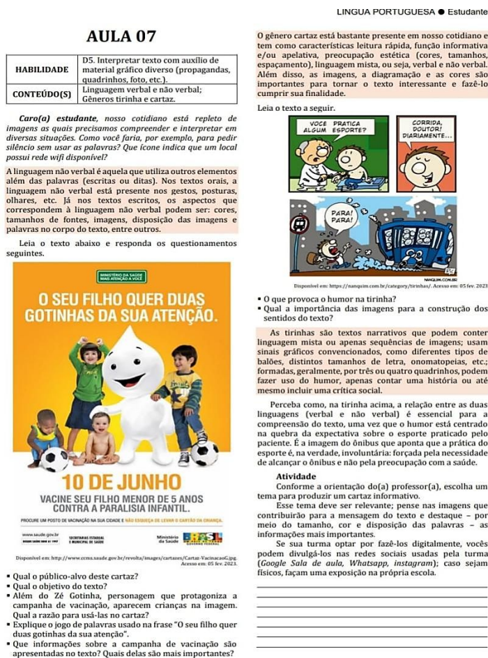
Figura 1- atividade 7 caderno pedagógico - SEDUC-MA