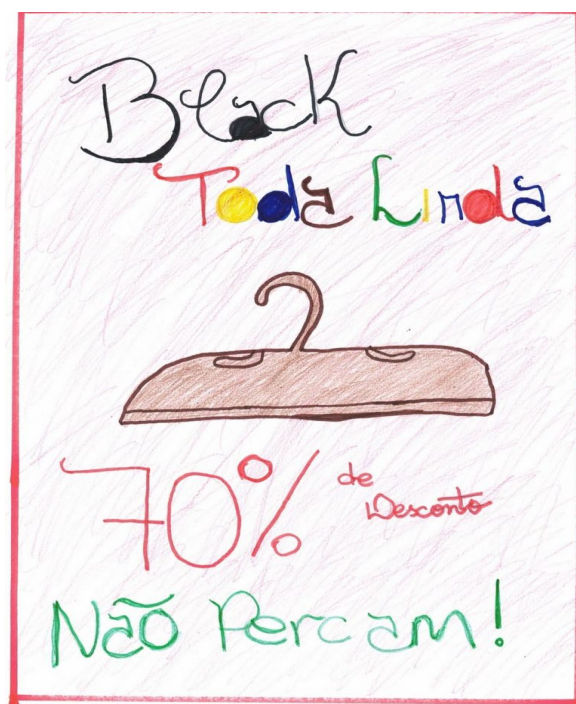
Figura 2- Produção de cartaz informativo