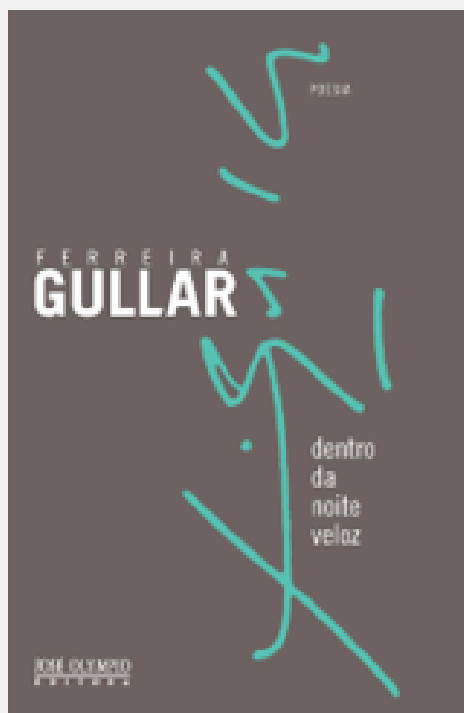
Imagem V: Capa da 6ª edição; Editora José Olympio. 2