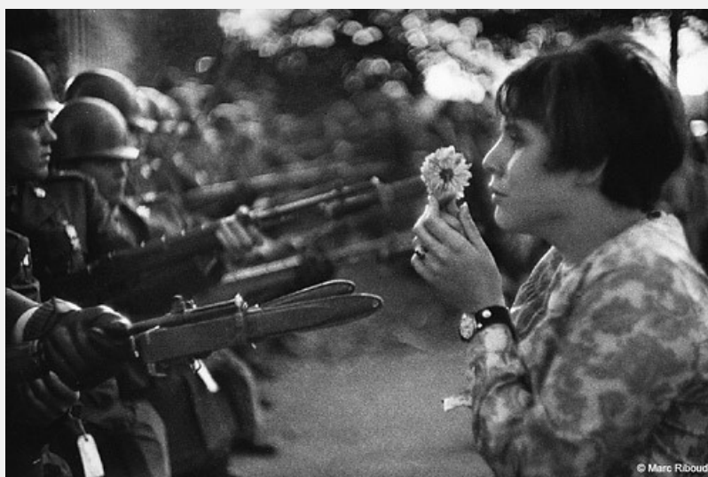
Figura 4: Adolescente americana enfrentando soldados com uma flor na mão em um protesto, em 1967. 3

Para introduzir o estudo do texto, os alunos farão a análise das seguintes imagens: