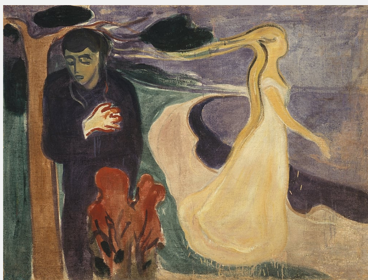
Figura 6: Separação , de Edvard Munch. 5

Para motivar os alunos e introduzir a Cantiga para não morrer, sugerimos que o professor apresente aos alunos a obra Separação (1896), do pintor norueguês Edvard Munch. Os alunos irão expor para a turma o que conseguem perceber a partir da pintura e do título da obra: o que a expressão do homem sugere? E a da mulher? Trata-se do fim de um relacionamento amoroso? Por quê?