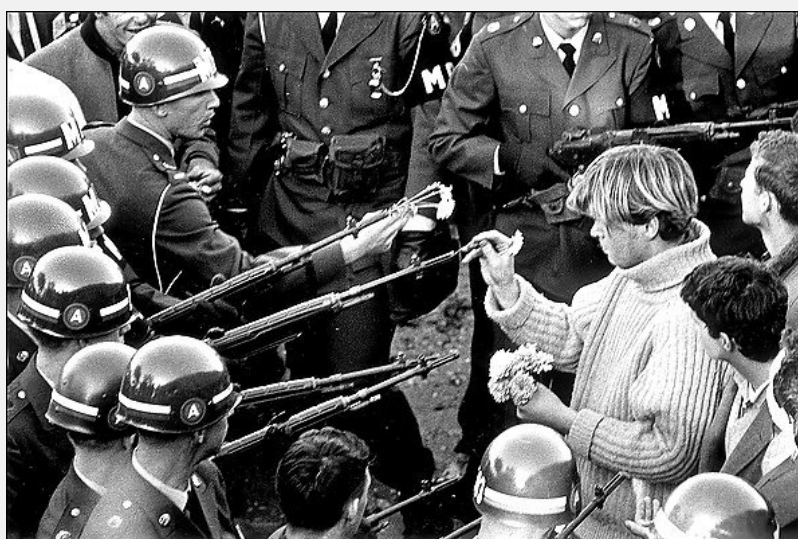
Figura 5: Jovem colocando flores nas armas dos soldados em protestos contra a Guerra do Vietnã, em 1967. 4