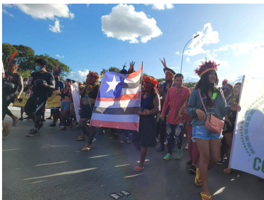
Figura 09: Povos Indígenas do Maranhão no ATL 2022

Atualmente a política da PNGATI está parada na gaveta do atual governo, o atual presidente eleito com o discurso de “nenhum centímetro de terra indígena a mais será demarcada”, mina as possibilidades de apoio financeiro do próprio programa. As articulações mais recentes em relação a retomada da PNGATI partiu do poder legislativo, A deputada Joenia Wapichana (REDE-RR) protocolou o Projeto de Lei nº 4347/2021, que institui a Política Nacional de Gestão Territorial e Ambiental de Terras Indígenas (PNGATI).