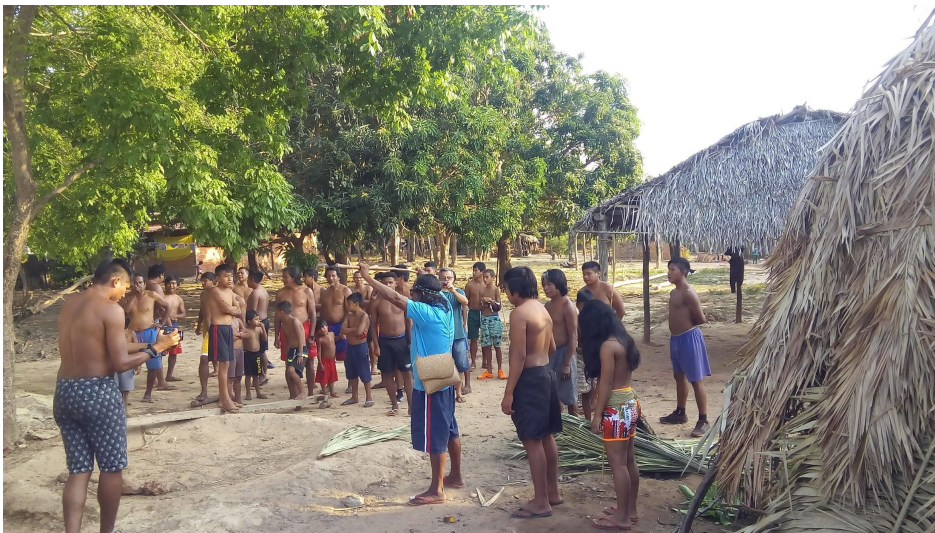
Figura 03: Ritual do Ceveiro Aldeia São José 7