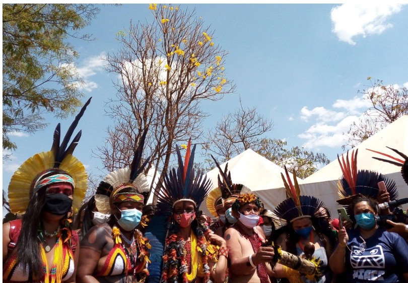
Figura 08: II Marcha das Mulheres Indígenas

emendas constitucionais, que ameaçam a existência e a continuidade dos modos de ser e de fazer oriundos de séculos de resistência e de luta, a presença física de mais de 170 povos indígenas - urge a emergência que de uma defesa e a garantia dos direitos indígenas.