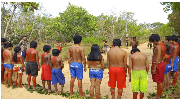
Figura 10: Registro da Corrida de Toras Aldeia São José