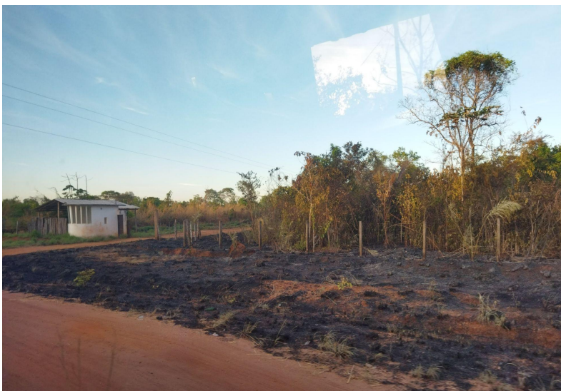
Figura 05: Incêndio próximo a Aldeia Jerusalém TI Krikati

tradicionais, e a crescente ocupação das áreas próximas às Terras demarcadas, chegou-se em um nível que está ameaçando a existência cultural e mesmo física das comunidades (Figura 5).