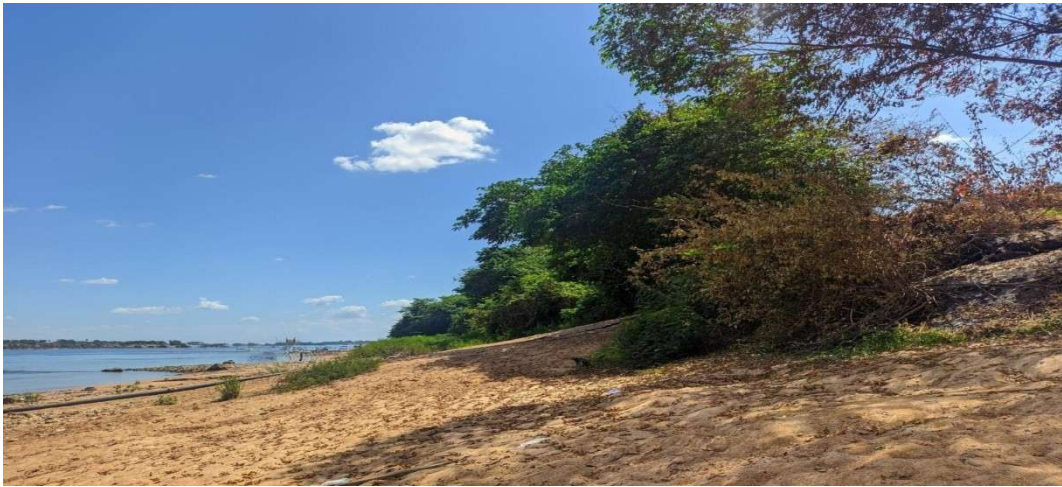
Figura 5 - Margem do Rio, 2025