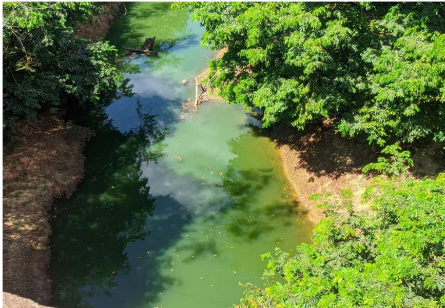
Figura 6 - Riacho do Cacau, 2025