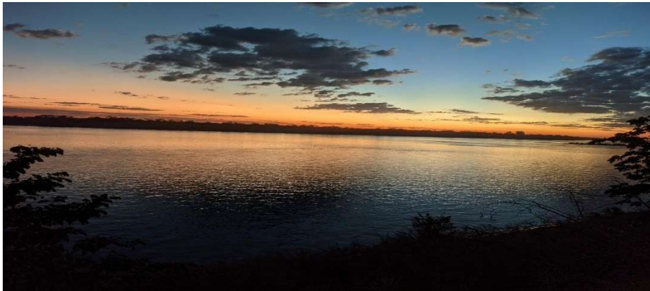
Figura 7 - Pôr do sol/Cair da tarde, Beira Rio