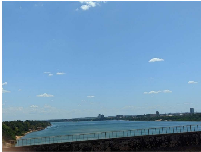
Figura 3 - Vista do Rio Tocantins, a partir da Ponte Dom Afonso