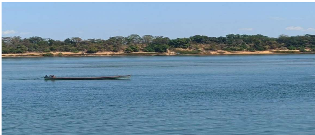
Figura 4 - Margens do Rio e Arredores

Nas figuras 4 e 5 estão representados os espaços naturais proporcionados pelo rio, que se relacionam diretamente com a canção ao citar os pontos de margens naturais do rio e de vegetação comuns nessa região (barrancas e capins), além dos meios de locomoção tradicionais, como barcos e barcaças.