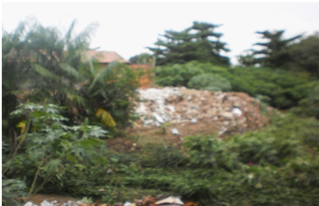
Figura 4 – Depósitos tecnogênicos nas margens do riacho Bacuri.