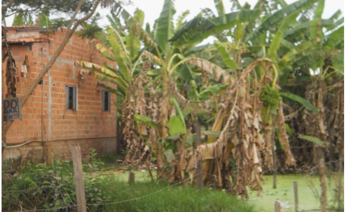
Figura 5 - Cultivo de bananeiras.

As habitações irregulares estão às margens desses riachos, causando assoreamento aos mesmos e risco de desabamento de casas dentro do riacho, expondo seus moradores o permanente risco de vida (figura 6). Paralela a esta situação, a falta de educação ambiental pode ser observada no descaso da população local, que despeja entulhos, e canalizam os esgotos domésticos para o leito do riacho, tornando suas águas fétidas.