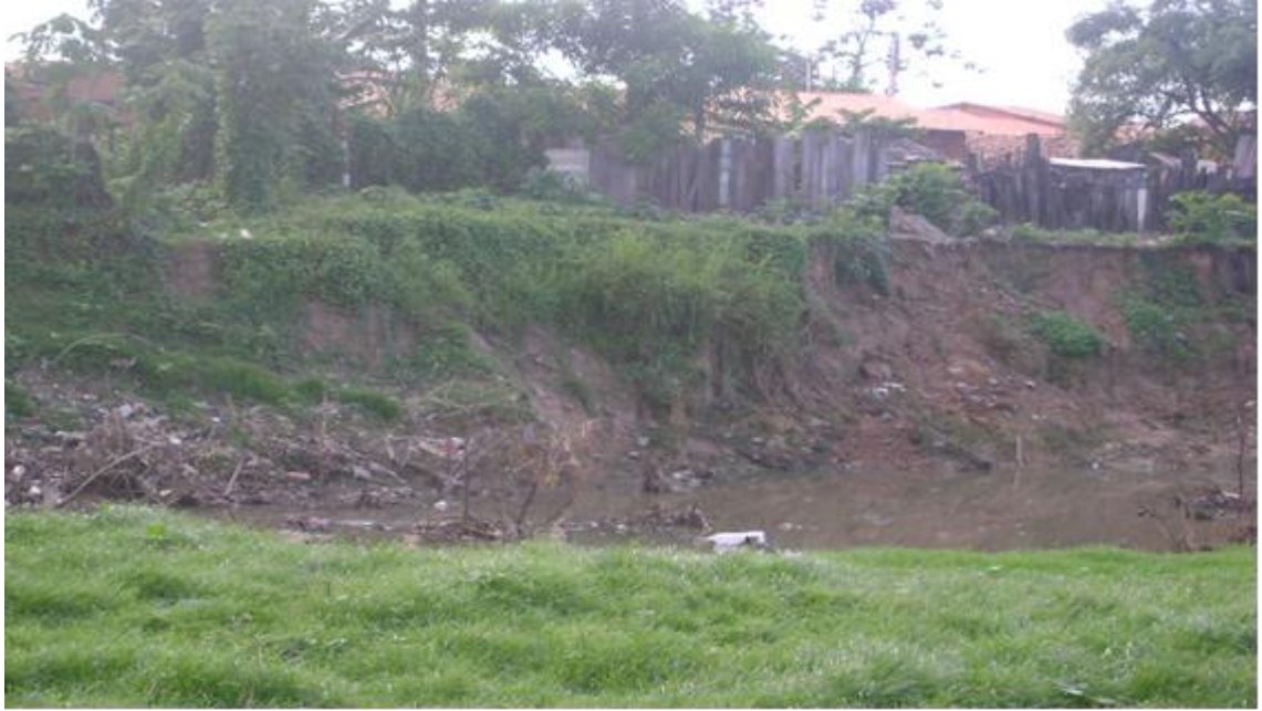
Figura 6 – Habitação em área de risco.

Verificou-se que o processo de ocupação do bairro da CAEMA foi responsável pela formação das áreas de conflitos (figura 7), cujo resultado dar-se-á da ocupação irregular do bairro. A expansão da cidade e a falta de controle da apropriação das áreas da APP e conseqüente desmatamento da vegetação ripária, vem provocando há várias décadas, impactos ambientais na área estudada.