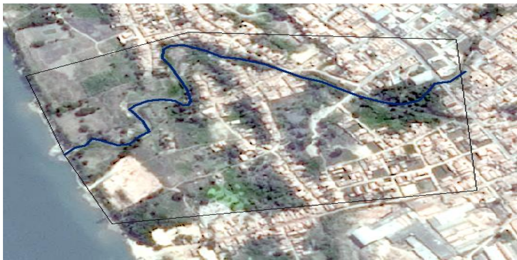
Figura 1 – Imagem de satélite Spot 6 da área objeto de pesquisa.

Já em último momento, para estabelecer a área de pesquisa usou-se imagem de satélite SPOT-6, com passagem em novembro de 2021 de resolução espacial de 10 metros. Os produtos cartográficos foram produzidos na plataforma do Arcgis 10.1 free. O uso da imagem de satélite (Figura 1) permitiu a produção do mapa de uso da Terra, áreas de conflitos, bem como realizar a análise do processo de ocupação irregular da área de estudo.