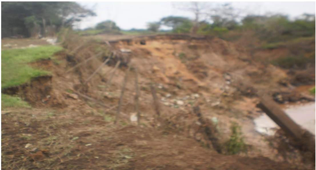
Figura 3 – Deslizamento de vertente as margens do riacho Bacuri.

Outro morador relata que no mês de janeiro/2021 os riachos inundaram e as águas invadiram as ruas, o único meio de transporte possível foi à canoa, mas apesar dos problemas existentes os moradores não têm intenção de sair da área, relata também que várias famílias já foram retiradas do local pela Defesa Civil, mas sempre voltam por causa da proximidade com o centro comercial da cidade.